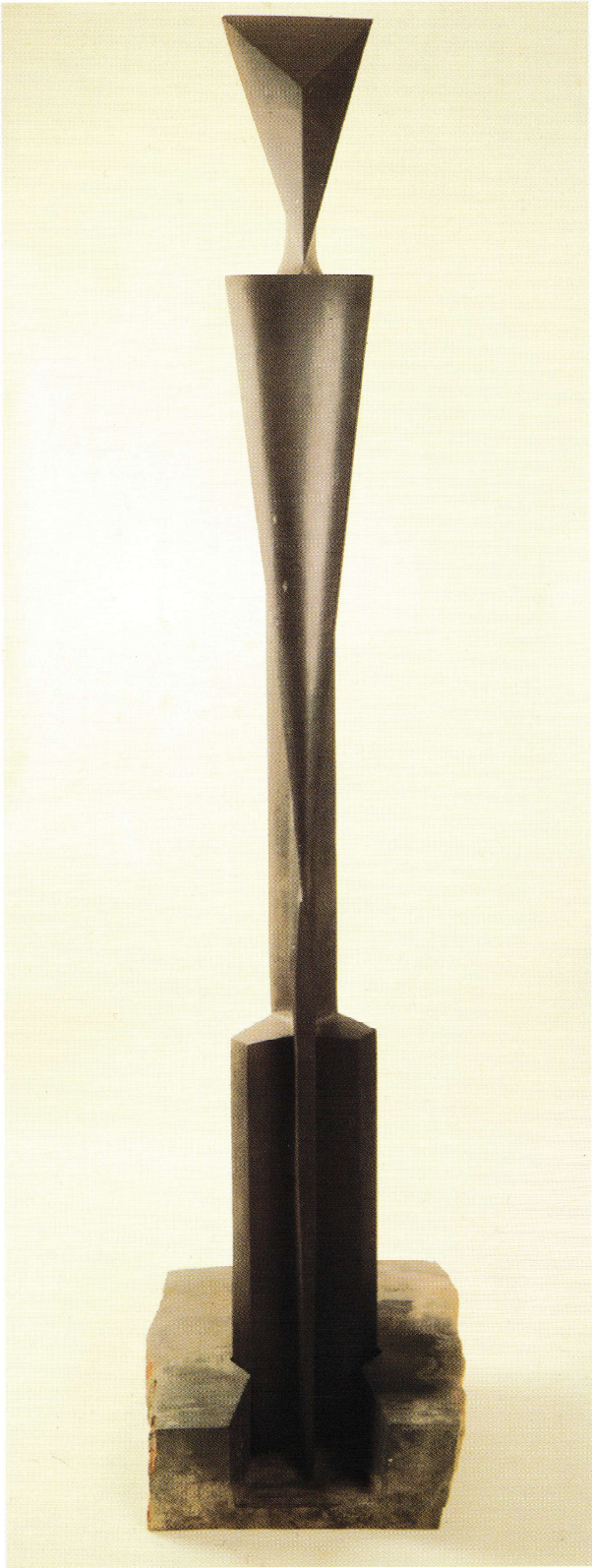
SIN TÍTULO Piedra de Calatorao 208 x 44 x 43 cm.