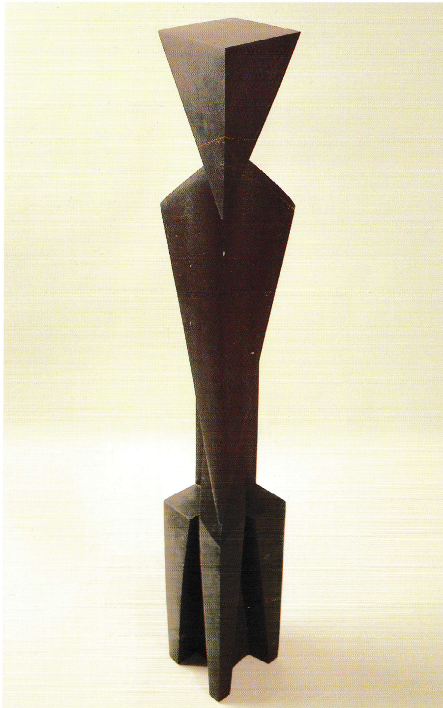
SIN TÍTULO Piedra de Calatorao 117 x 15 x 35 cm.