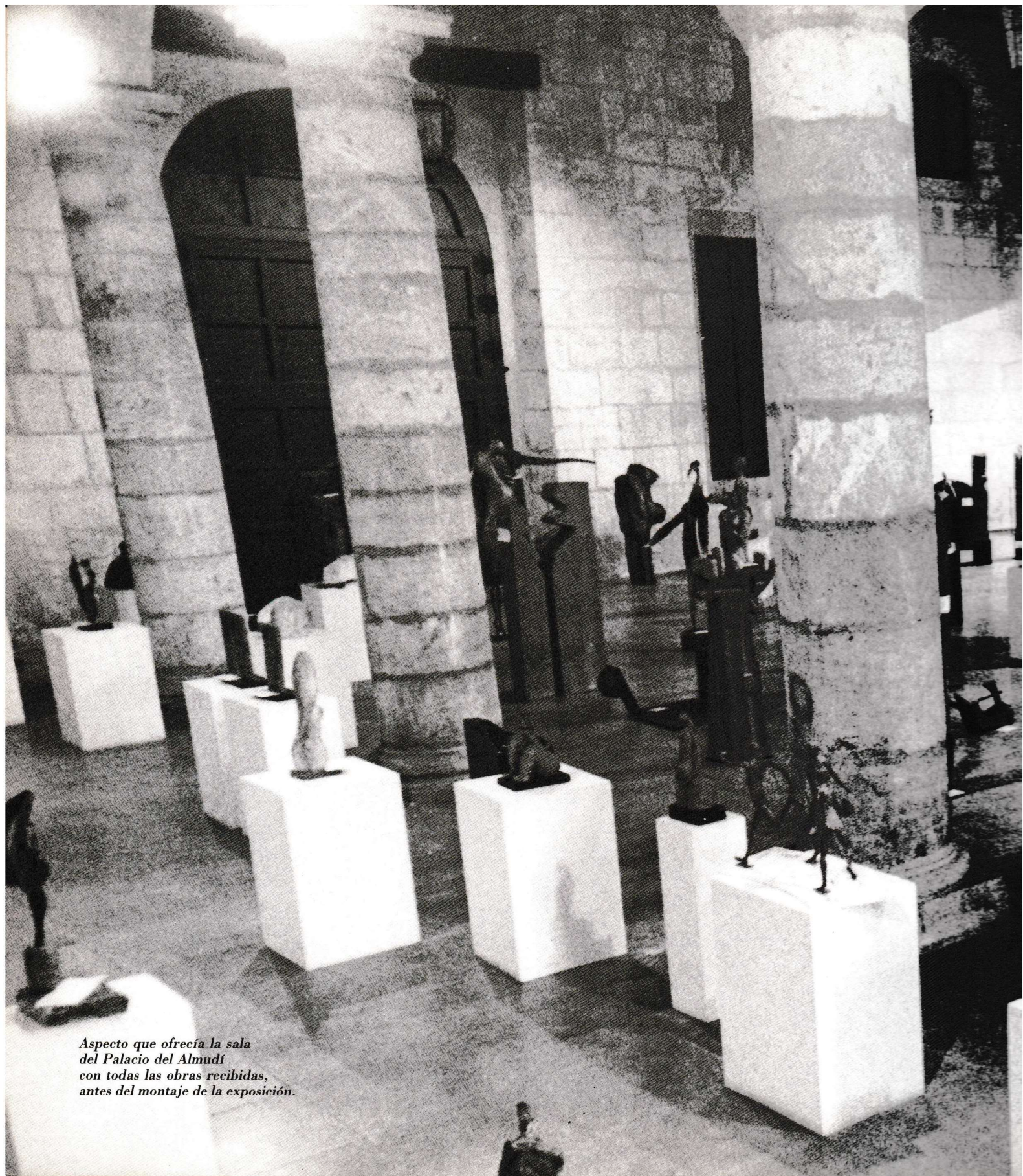
Aspecto que ofrecía la sala del Palacio del Almudí con todas las obras recibidas, antes del montaje de la exposición.