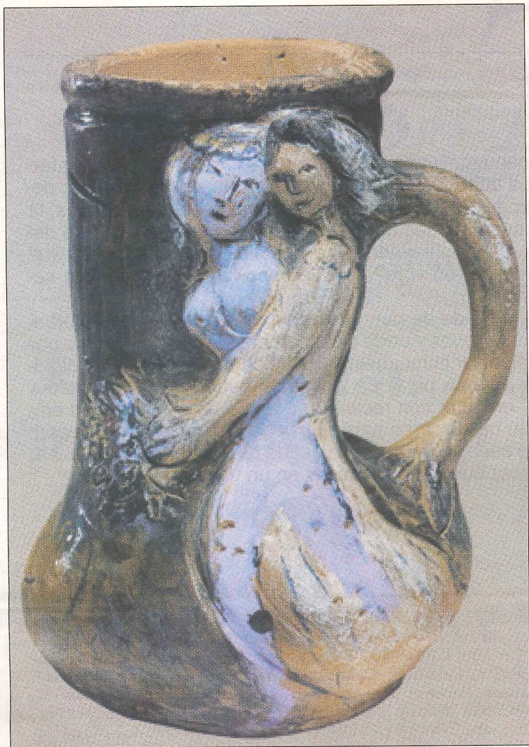
"La promenade", de Marc Chagall

Hasta el 25 de mayo en el Museo de Arte Moderno de Céret, Francia