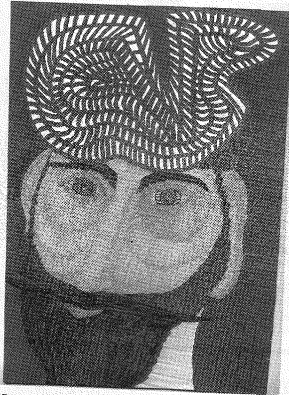
"Don Quijote", de Andrés F. Alcántara, 2005, técnica mixta, 20'5x28'5 cm, sobre cartulina