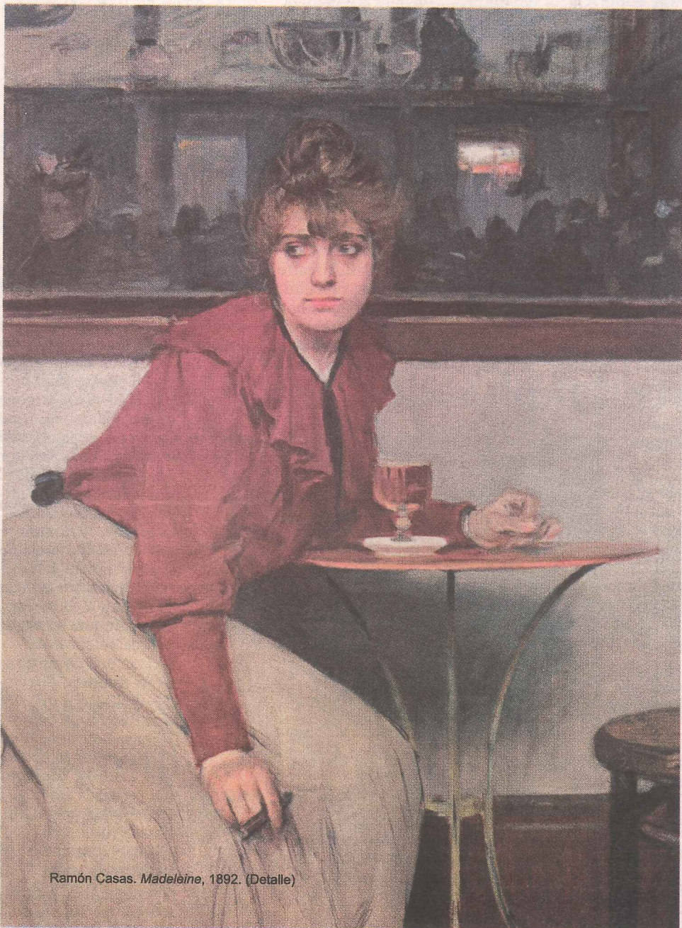
Ramón Casas. Madelaine, 1892. (Detalle)

• Y en Cubo Espacio, calle Princesa, 18, bajo exterior, exposición de la artista Amparo Flórez Montero de Espinosa .