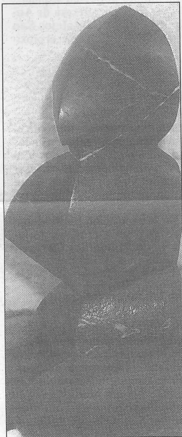
"Halcón", 1997, piedra de calatorao, 28x17x10 cms. de Alcántara

Escultor muy galardonado, entre los reconocimientos obtenidos es: Primer Premio del XIV Certamen Nacional de Escultura de Caja Madrid , Segundo Premio en el XXII Concurso Rafael Zabaleta de Quesada , Premio Nacional de Escultura "Ciudad de Punta Umbría" y Premio Jacinto Higueras , 1996.