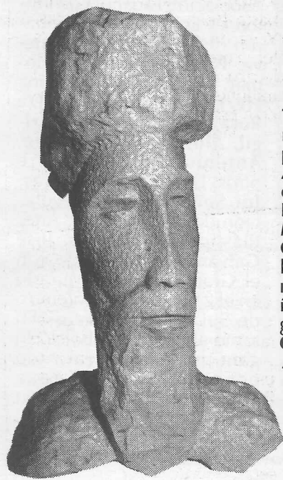
"Gerión", premio que otorga el Punto de las Artes

mio Manuel de la Dehesa de Arquitectura se ha concedido a Rafael Moneo por el Kutsaal, de San Sebastián. A Cristóbal Gabarrón la Junta de Castilla y León lo ha distinguido con el Premio de las Artes; entre los premiados "Castellanos y leoneses del mundo", por Unidad Editorial, figuran Venancio Blanco , en arte, y Cristóbal Halffter en música.